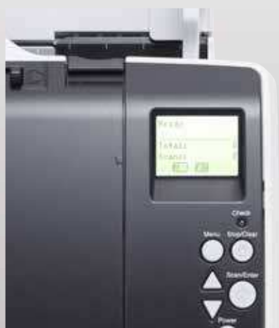
Встроенная подсветка повышает функциональность LCD-панели управления

Панель управления с LCD-дисплеем с подсветкой предоставляет мгновенный доступ к информации, в том числе параметрам сканера, его рабочему состоянию и счетчику бумаги. На панели можно с легкостью выбирать предварительно заданные стандартные процедуры сканирования, созданные с помощью мощного решения PaperStream Capture, поставляемого в комплекте.