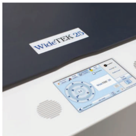
Большой сенсорный экран

Сканеру требуется менее трех секунд, чтобы сканировать документ размером 47x63,5 см в обычном режиме с разрешением 300 dpi и лишь 12 секунд в 3D-режиме с разрешением 600 dpi. Управляйте сканером из стандартного web-браузера, встроенного в сенсорный экран или посредством мобильного устройства на iOS либо Android с помощью нашего приложения Scan2Pad®.