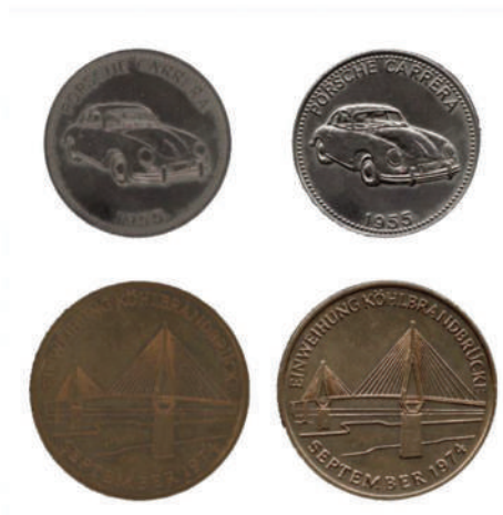
2D-скан по сравнению с 3D

WideTEK 25 является оптимальным выбором для решения любой задачи благодаря следующим особенностям: