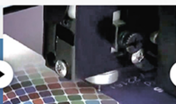
Резка и биговка