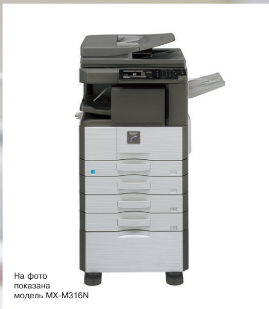
На фото показана модель MX-M316N

ГОТОВОЕ К РАБОТЕ В СЕТИ Ц/Б МФУ ФОРМАТА А3 С ВОЗМОЖНОСТЬЮ РАСШИРЕНИЯ КОНФИГУРАЦИИ