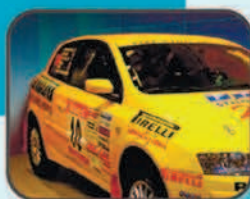
▶ ПВХ винил/антигравийные пленки