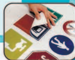
▶ Световозвращающие пленки/пленки для пескоструйной обработки