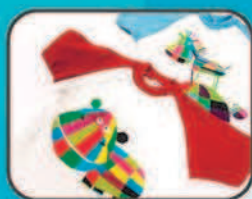
▶ Пленки для термотрансфера