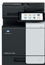
bizhub i-Series C4050i

По мере роста вашего бизнеса, мы будем расти вместе с вами — органично объединяя людей и пространство, создавая новое окружение с защищенными бизнес-процессами и документооборотом.