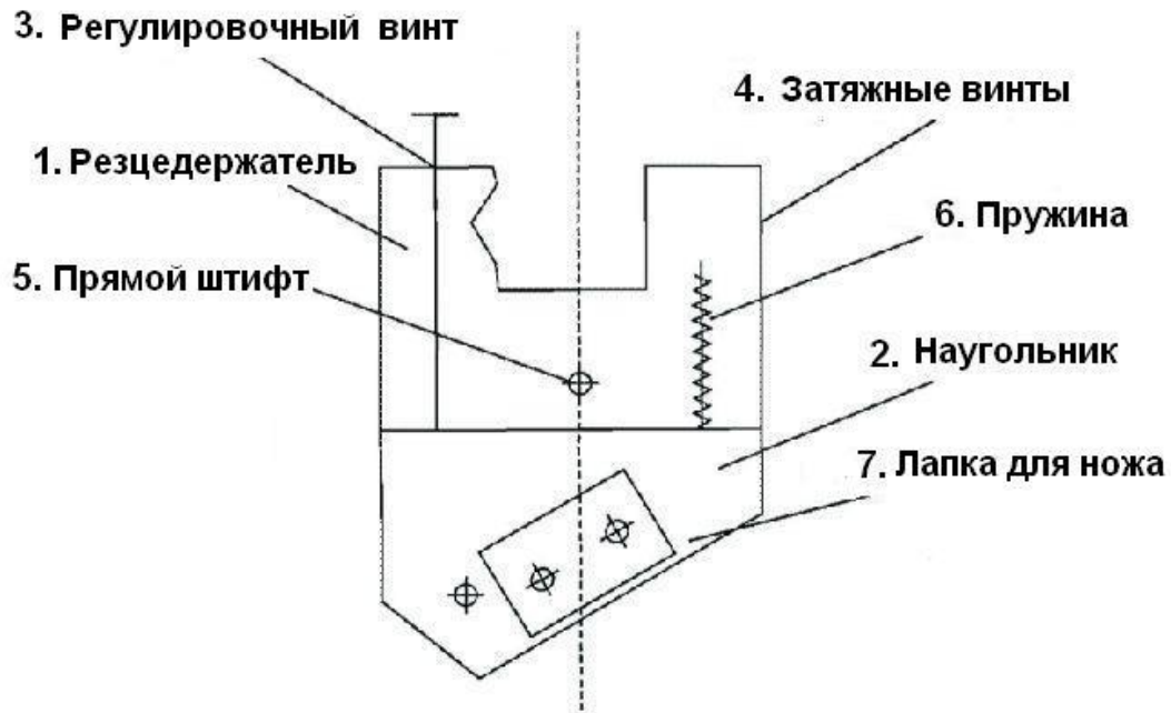
Схема конструкции :