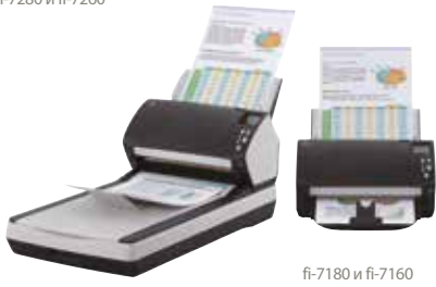
fi-7180 и fi-7160

fi-7160/fi-7260 – A4 пейзаж при разрешении 300 точек на дюйм, 60 страниц в минуту / 120 изображений в минуту fi-7180/fi-7280 – A4 пейзаж при разрешении 300 точек на дюйм, 80 страниц в минуту / 160 изображений в минуту Сканирование смешанных партий документов с помощью накопителя на 80 листов