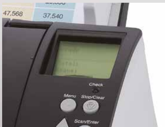
Встроенная панель управления с ЖК индикатором

Сканеры fi-7180, fi-7280, fi-7160 и fi-7260 оснащены функциями централизованного управления, которыми могут воспользоваться системные администраторы для установки и эксплуатации нескольких сканеров, мониторинга текущего состояния, а также обновления драйверов и программного обеспечения в удаленном режиме. Это существенно сокращает расходы и усилия, необходимые для настройки, управления и обслуживания множества сканеров в организации и в расширяющейся сети сканеров, расположенных в разных местах.