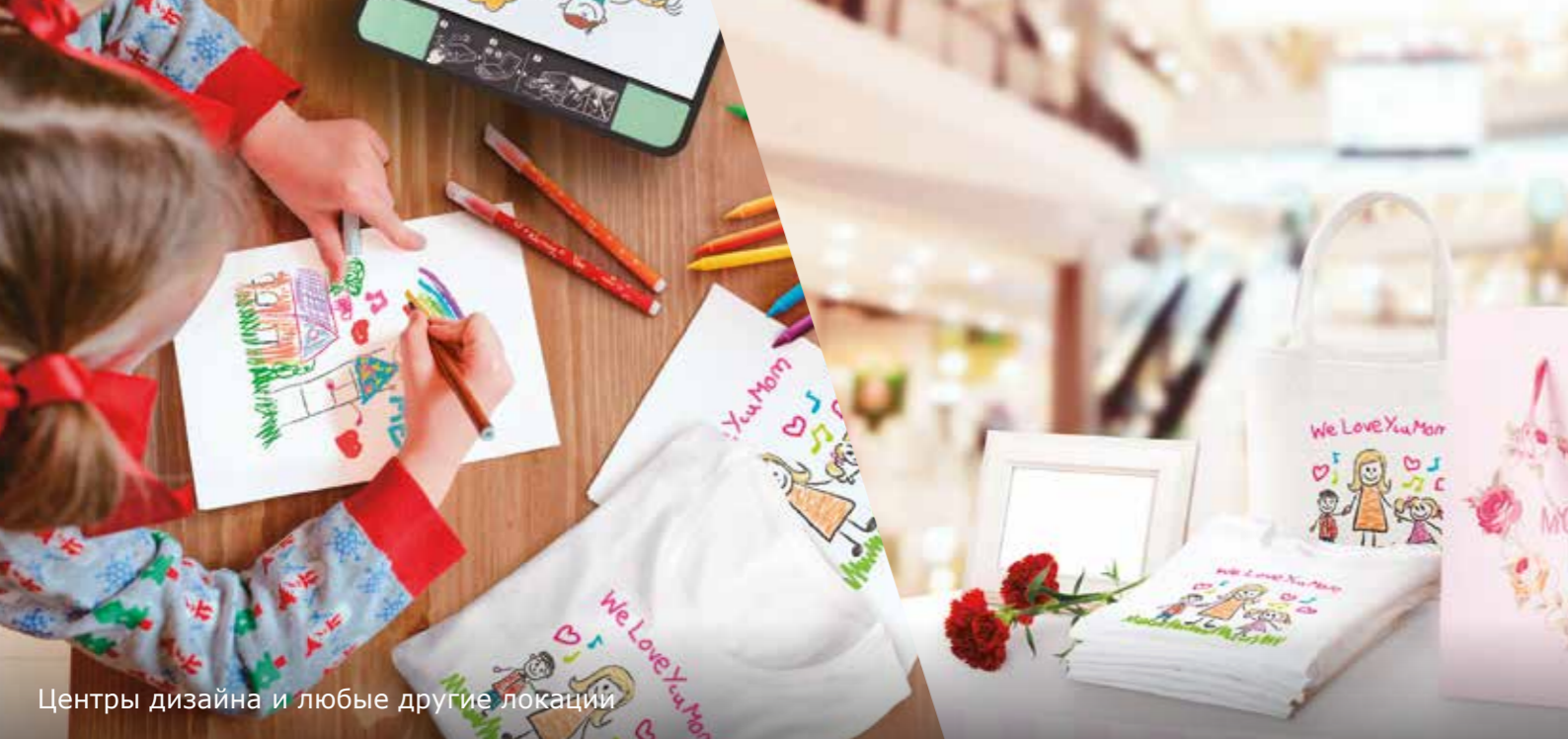
Центры дизайна и любые другие локаций