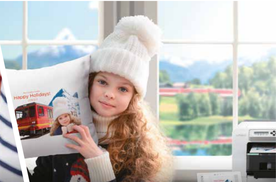
Сувениры для отелей и курортов