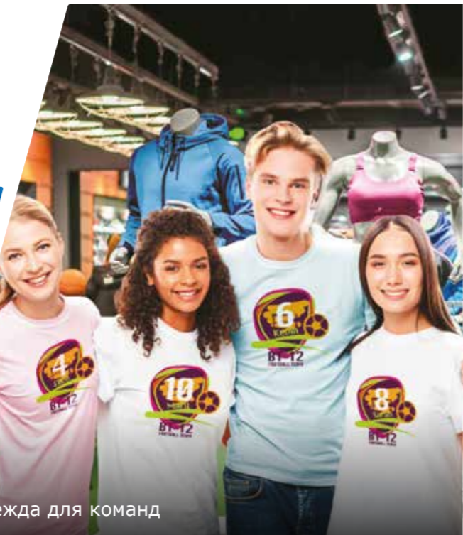
Одежда для команд