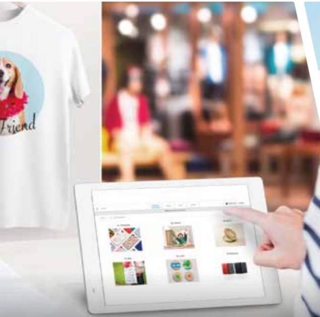
Изделия с индивидуальным дизайном