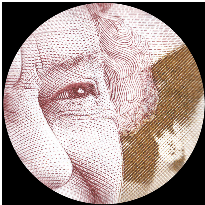
Увеличение фрагмента исследуемого объекта