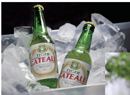
Создание персонализированных этикеток с плашечным белым цветом