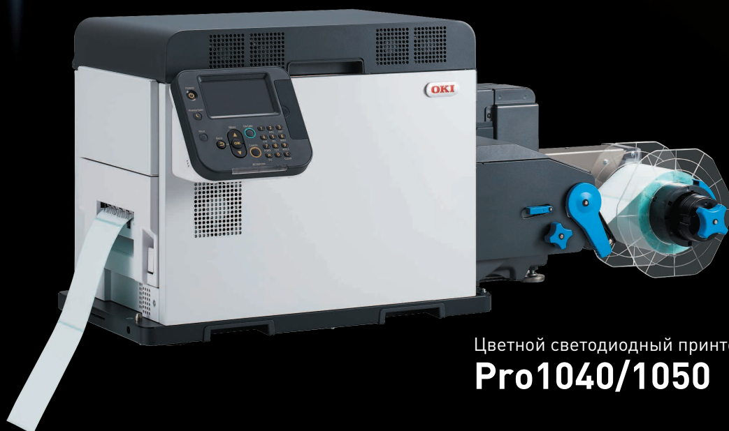
Цветной светодиодный принтер для этикеток Pro1040/1050

Модель Pro1050 позволяет создавать потрясающие этикетки для продуктов питания, напитков, косметики и невероятно широкий спектр других материалов.