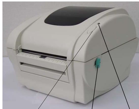
Кнопка подачи Индикатор питания Рычаг открытия верхней крышки