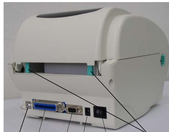
USB RS-232 Centronics Разъем питания Переключатель питания Задняя направляющая бумаги