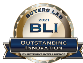
Xerox Adaptive CMYK+ Kits

Автоматизация управления цветом вышла на новый уровень благодаря интегрированному оборудованию и программным инструментам. Встроенный спектрофотометр X-Rite® с пакетом Color Profiler Suite, работающим с автоматизированной системой контроля качества цветопередачи (ACQS), устраняет неоднородность цвета, сокращая нестабильность трудоемкой ручной корректировки цветов и снижая вероятность ошибки оператора.