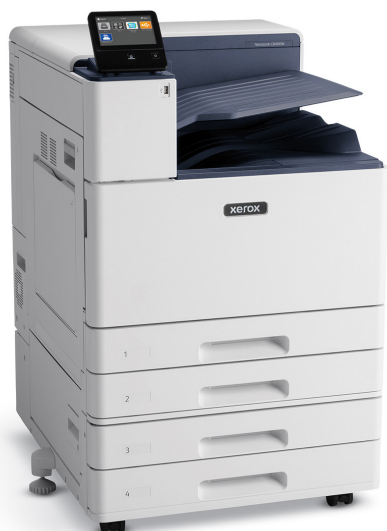
VersaLink® C8000W с двухлотковым модулем