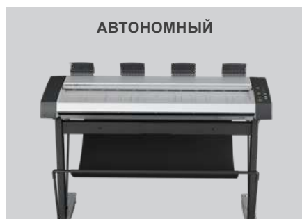
Сканирование с удаленного ПК