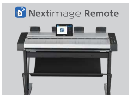
Дистанционное управление ПО Nextimage с планшета