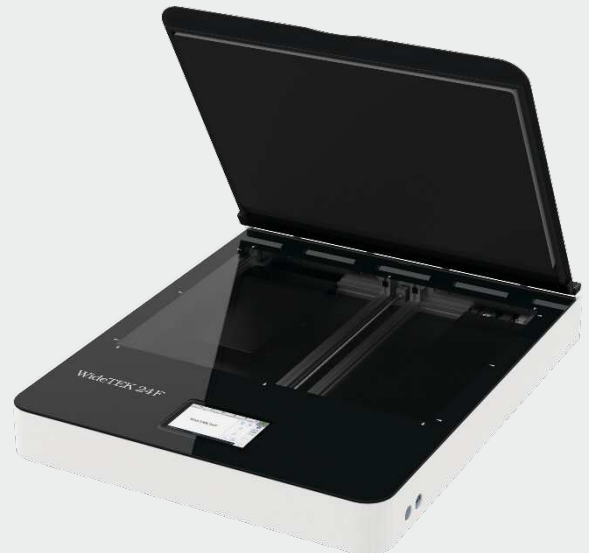
Стеклянная пластина с защитой от повреждений позволяет сканировать крупные оригиналы