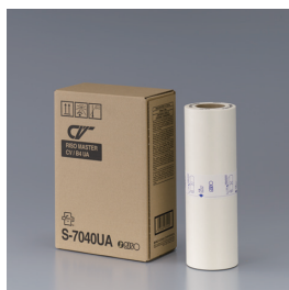
Мастер-пленка RISO MASTER CV B4 (200 листов в рулоне)