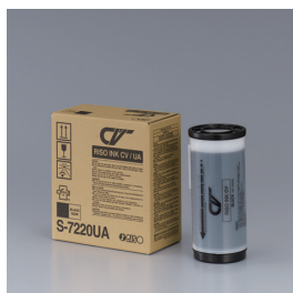
Краска RISO INK CV BLACK (800 мл в тубе)