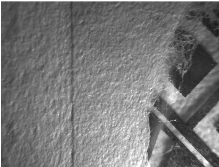
Инфракрасный косопadaющий свет (880 нм) X1