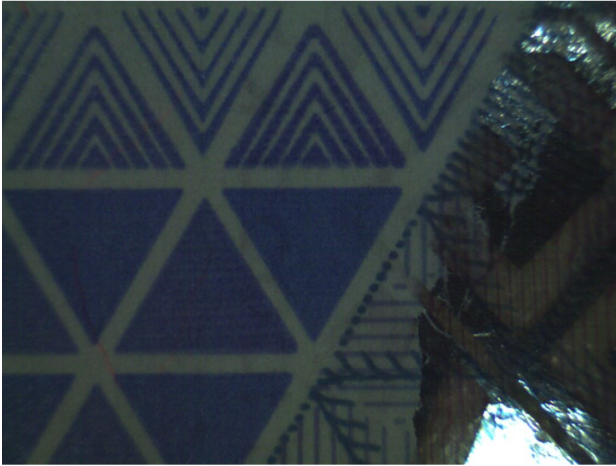
Инфракрасный высокоинтенсивный свет (980 нм) X1