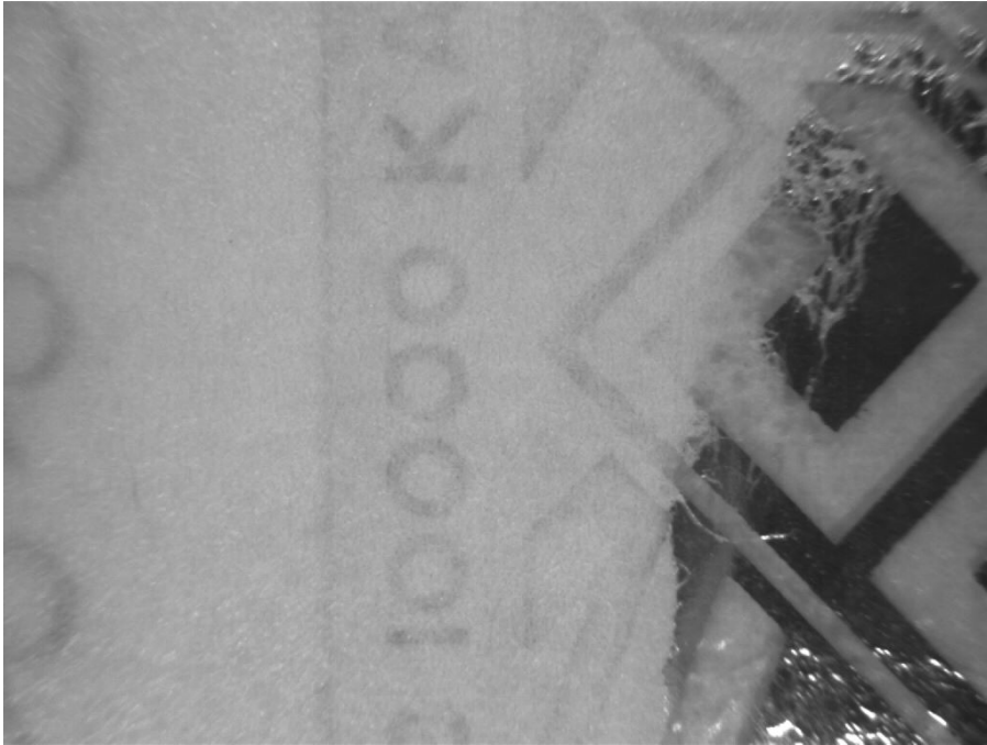
Инфракрасный верхний свет (940 нм) X1