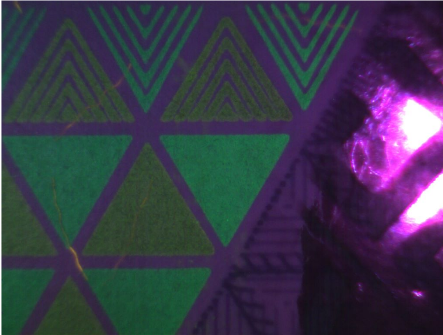
Ультрафиолетовый верхний свет (365 нм) X1