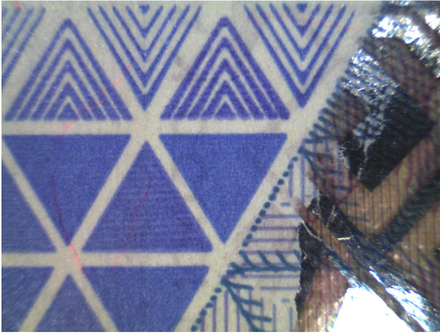
Белый верхний свет X1