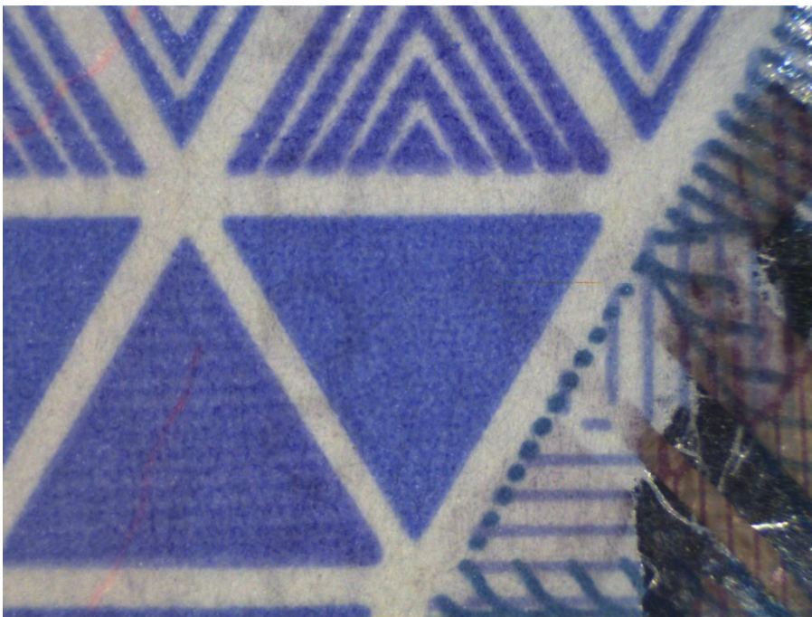
Белый верхний свет X3