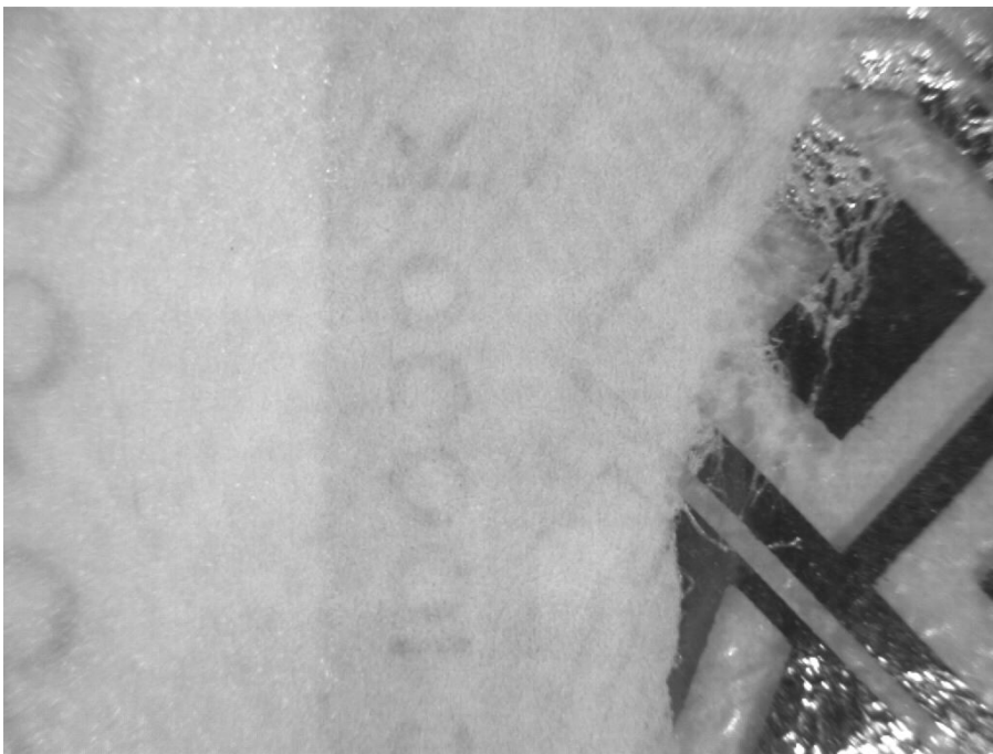
Инфракрасный верхний свет (870 нм) X1