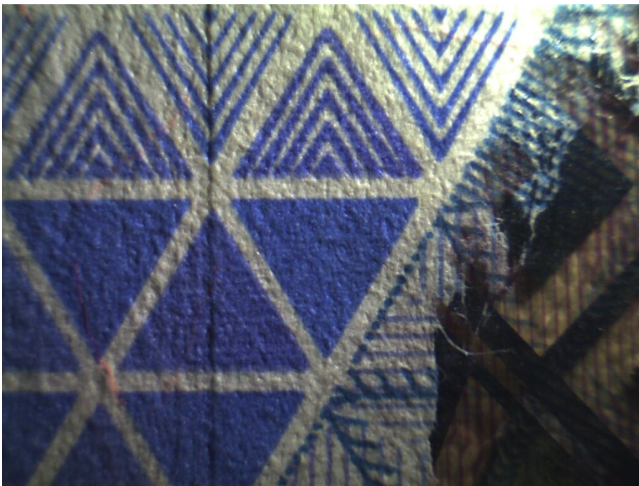
Белый косопadaющий свет X1