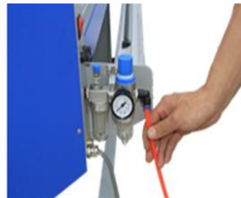
3. Подключите трубку (от компрессора) к воздушному входу водно-масляного сепаратора.