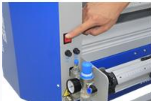
5. Включите ламинатор