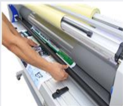
13. Опустите прижимной вал чтобы зафиксировать отпечаток.