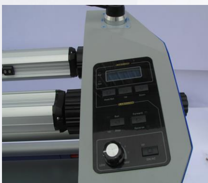
16. Опустите вал.