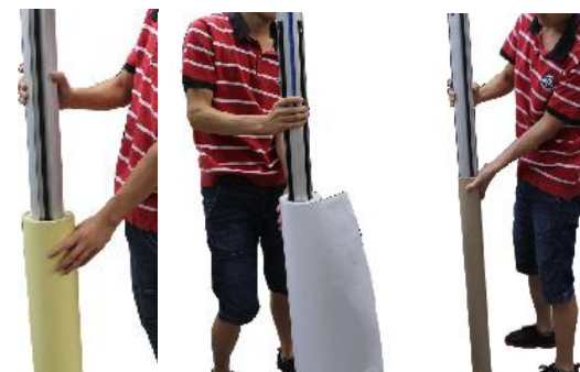
6. Разместите рулон прозрачной самоклеящейся пленки и пустую гильзу (для намотки подложки) на верхних валах, ламинируемый материал и пустую гильзу (для намотки готового изделия) на нижних валах и выровняйте их друг относительно друга используя линейки на валах.