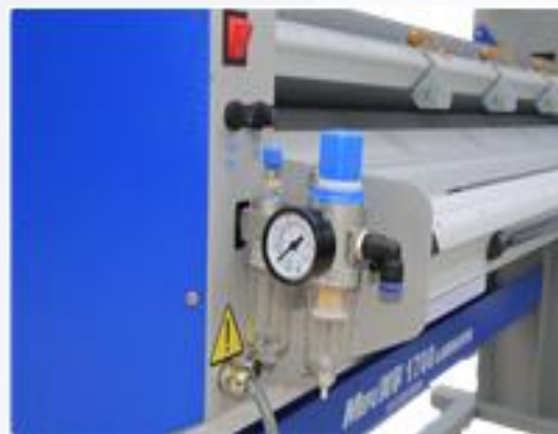
2. Установите водно-масляный сепаратор