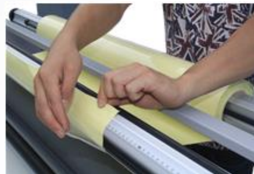
9. Отклейте пленку.