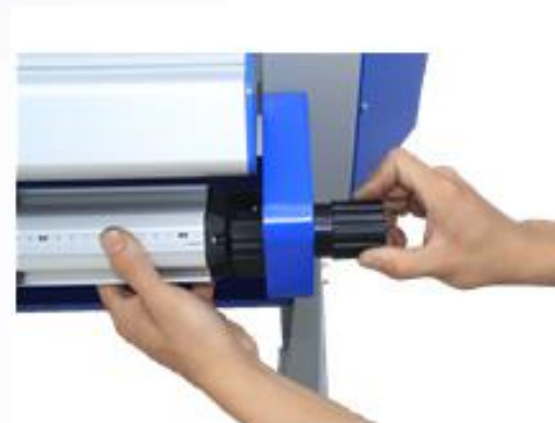
15. Отрегулируйте натяжение в зависимости от материала.