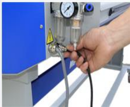
4. Подключите педаль.