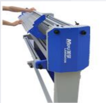
1. Поднимите рабочий стол.