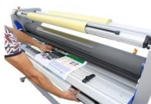
12. Заправьте отпечаток в ламинатор.