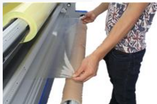
11. Протяните плёнку и закрепите на гильзе.