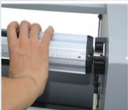
7. Поверните фиксаторы