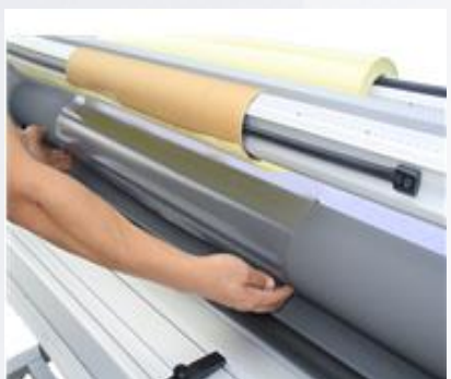
10. Заправьте пленку в ламинатор.