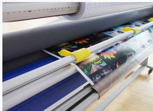
17. Отрегулируйте позиции ножей