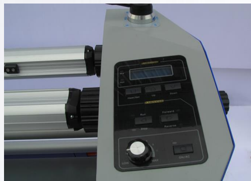
8. Поднимите вал, повернув ручку.