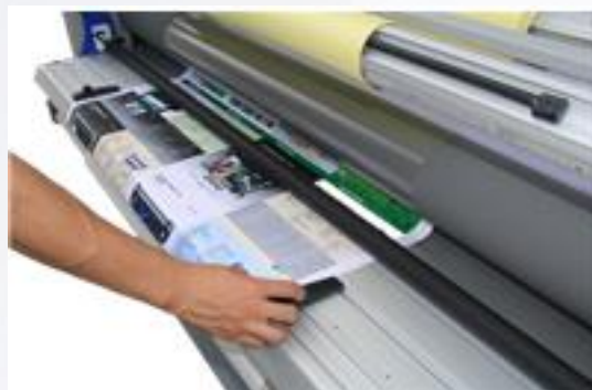
14. Ровно заправьте материал, используя прижимной вал.