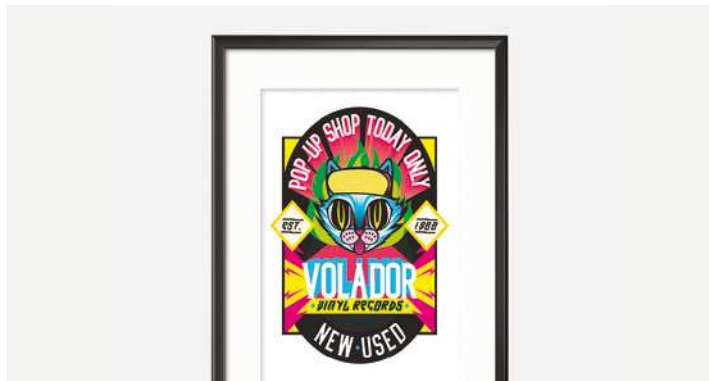
ВЫВЕСКИ И ПЛАКАТЫ