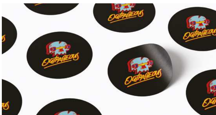
ЭТИКЕТКИ, ВЫРЕЗАННЫЕ ПО КОНТУРУ