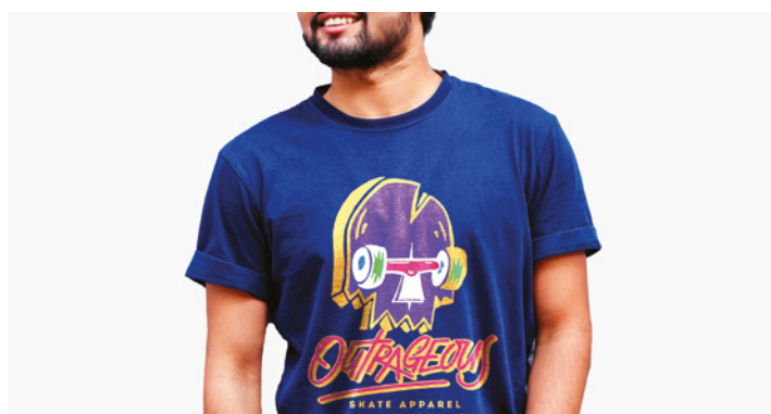
ОДЕЖДА С ТЕРМОТРАНСФЕРНОЙ ГРАФИКОЙ