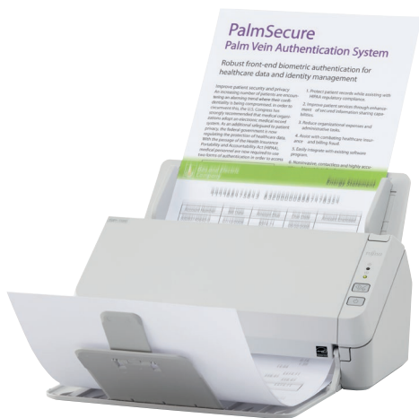
Надёжное повседневное сканирование