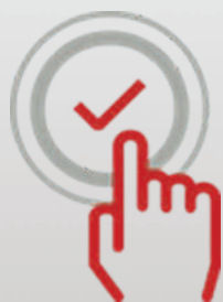
Сканирование одним нажатием

Использование ведущих технологий, многолетний опыт, фирменное качество и надёжность продукции позволили компании Fujitsu завоевать к себе доверие миллионов пользователей по всему миру как к одному из ведущих производителей сканеров.